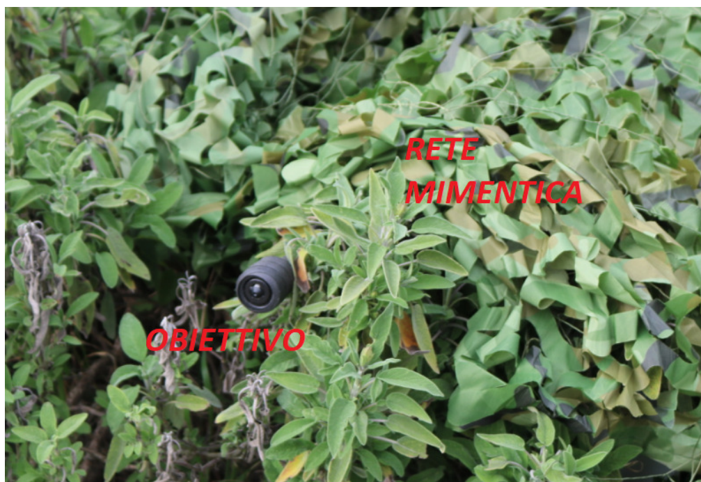
Figura 1: Mimetica Vegetale

Il sistema è mimetizzabile tramite la rete finta vegetale, rete mimetica sahara, o in alternativa è possibile occultare all'interno di contenitori adatti alla mimesi come panettone stradale o scatole per quadro stradale ENEL.