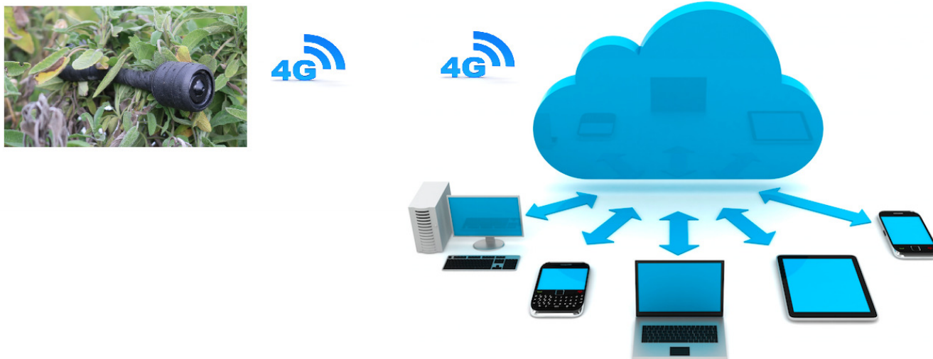
Figura 3: Cloud