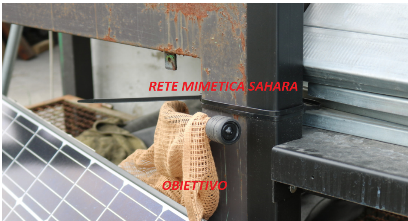
Figura 2: Mimetica Sahara

estrapolare un video in diretta. Al termine delle registrazioni le immagini possono essere